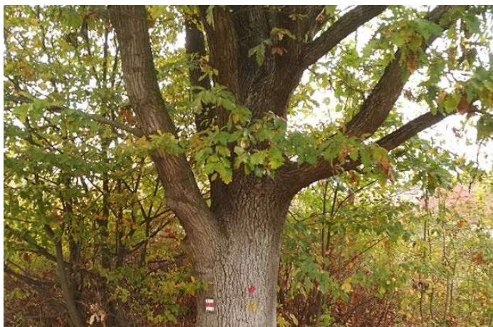
První dub ze čtyř ve směru odspodu – od vodárny

My, níže podepsaní, protestujeme proti kácení čtyř zdravých vzrostlých dubů v ulici U Vodárny v místní části Arnultovice v Novém Boru. Domníváme se, že není nutné tyto stromy kácet. V rámci opravy plynovodu navrhujeme využít všechny dostupné technologie šetrné ke kořenovému systému bez nutnosti odstranění vzácných